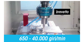
650 - 40.000 giri/min

Caricamento automatico di Air Turbine Spindles® grazie al nostro dispositivo di montaggio per cambio utensili automatico TMA.