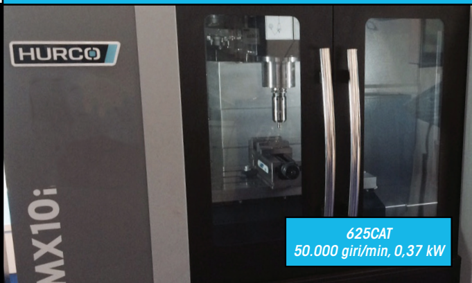
625CAT 50.000 giri/min, 0,37 kW

Caricamento manuale o automatico per risparmiare tempo e denaro