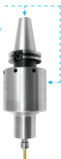
650(X) 0,60 - 1,04 kW