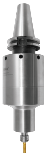
660(X) 0,70 - 1,19 kW

Con il sistema brevettato e controllato Air Turbine Spindles® la vostra macchina Hurco VM/VMX diventa una macchina ad alta velocità!