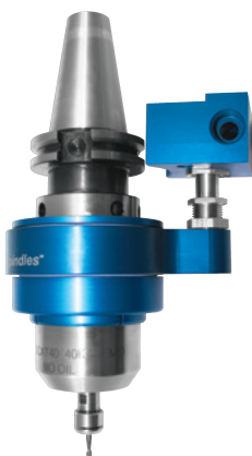
625(X) 0,30 - 0,58 kW

Ingresso dell'aria laterale o posteriore